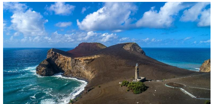
Vulcão dos Capelinhos