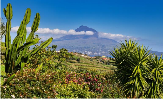
Vulkan Pico auf der Insel Pico