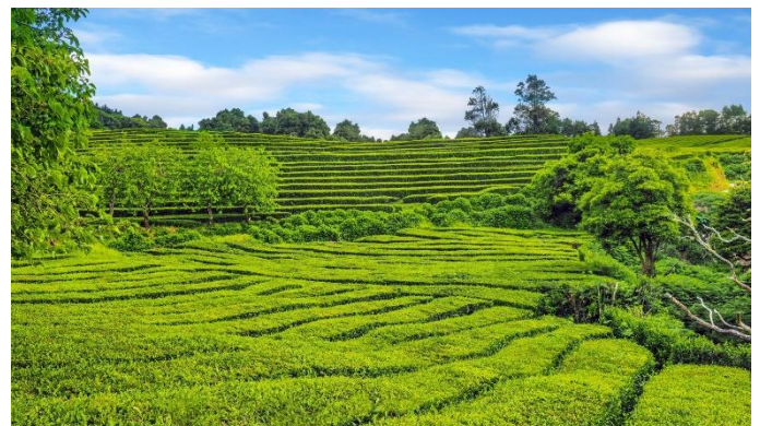
Teeplantage bei Gorreana auf der Insel São Miguel

Am Morgen erfolgt der Transfer zum Flughafen und der Rückflug von Terceira via Lissabon nach Wien. (F)