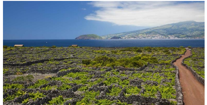
Weinanbau auf Pico

Heute steht die Erkundung der Insel Terceira am Programm. Erstes Ziel ist die Serra do Cume. Von oben hat man am Miradouro da Serra do Cume auf 545m Höhe einen schönen Blick auf den flachen Riesenkrater Caldeira da Guillerme Moniz auf der einen Seite, die Serra do Moriaio in Richtung Angra sowie die gesamte Bucht um Praia da Vitoria. Biscoitos ist ein freundliches Städtchen mit Weinanbau an der Nordküste. Weiter geht es zum Algar do Carvão. Eigentlich wäre hier der schönste Schauplatz für die berühmte Geschichte von Jules Vernes: „Die Reise zum Mittelpunkt der Erde“. Stellen Sie sich vor, Sie könnten das Innere eines Vulkans besuchen. Nun, auf den Azoren ist alles möglich. Der Algar do Carvão (E) bietet mit seinem offenen Krater tatsächlich dieses einmalige Erlebnis. Durch ein modernes Besucherzentrum geht es auf bequemen Wegen und über Treppen hinab zur Höhle, die wunderschön aufgrund ihrer mineralogischen Besonderheiten in verschiedenen Farben erscheint. Die Serra de Santa Bárbara zählt neben der Serra do Cume zu den Highlights von Terceira. Die Serra de Santa Bárbara ist mit 1.021m Höhe die höchste Erhebung und bietet grandiose Ausblicke über den gesamten Inselwesten. Zum Abschluss dieser abwechslungsreichen Inselrundfahrt genießen wir noch den Ausblick vom Monte Brasil, dem Hausberg von Angra do Heroísmo. (F)